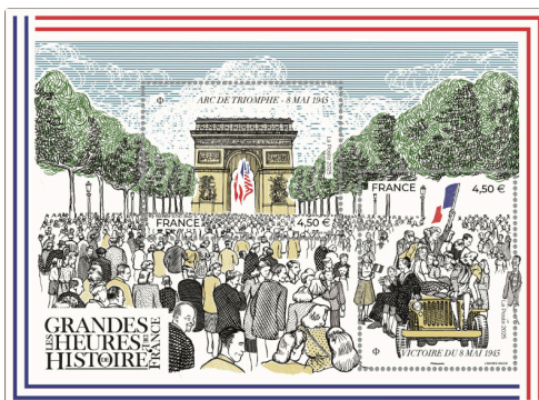
1125123_GHHF_80 ANS VICTOIRE 8 MAI 1945.jpg