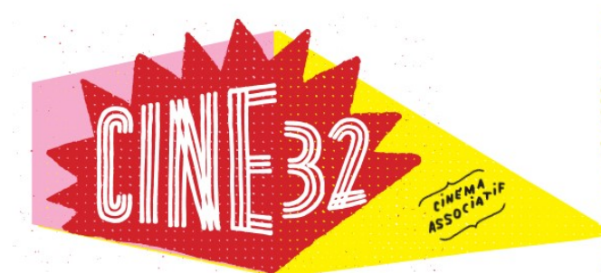
Le Printemps du cinéma et autres rendez vous

LE PRINTEMPS DU CINÉMA aura lieu du 23 au 25 mars. L'intégralité des séances seront au tarif unique de 5€.