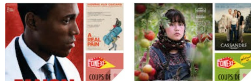
PJ CINE 32.jpg