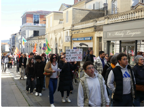
Un soutien de taille.JPG