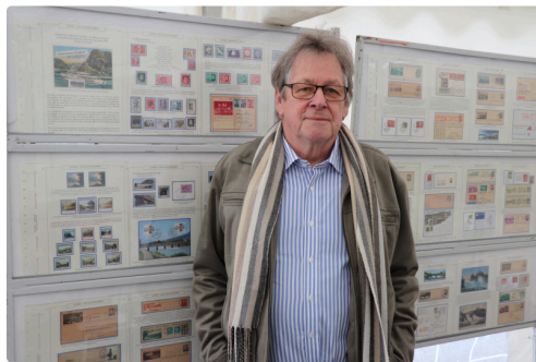
Auch 08032025 (5).JPG

Pour se procurer les souvenirs philatéliques, contacter l'association gersoise Philajeune, philajeune@laposte.net Enveloppes, et cartes oblitérées du timbre à date « Auch 8 mars 2025 ».