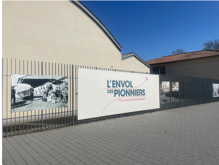
La chronique de Neyla : l'Envol des Pionniers, sur les traces des héros de l'Aéropostale

Neyla Dahrouch , gersoise étudiante en journalisme passionnée, vous invite chaque dimanche à découvrir les trésors de la Ville Rose.