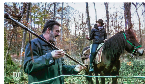
Avec le facteur de bâtons gascons - Photo prise sur l'écran