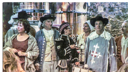
Au domaine de Tariquet - Photo prise sur l'écran

(2) On peut le voir chaque année en août au Festival d'Artagnan de Lupiac. (3) On sait que la famille Grassa est ce mécène gascon qui a financé la statue équestre en bronze de d'Artagnan, œuvre de Daphné du Barry, mise en place en 2015 sur la place du village.