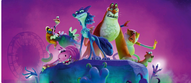
Cinequanon : le programme des vacances !