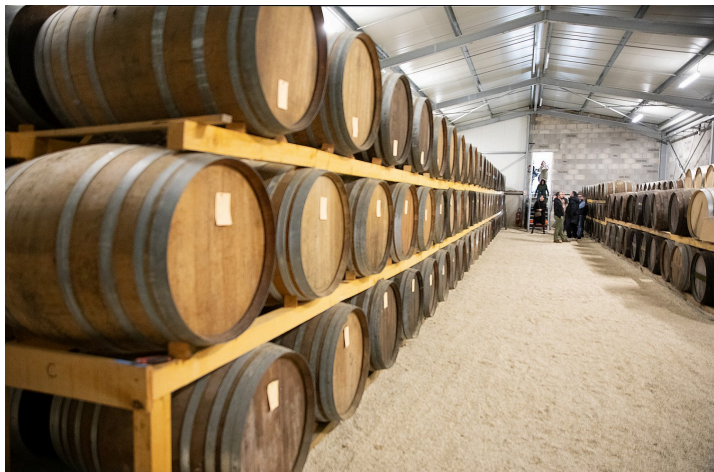
Le chai d'armagnac