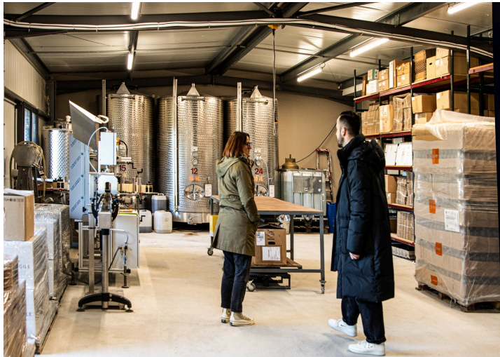
Mise en bouteilles de l'armagnac