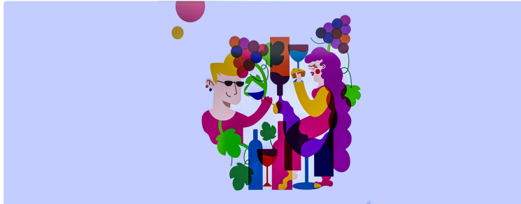
Domaine de Joÿ à Panjas : une offre œnotouristique complète

« Une famille, un terroir, 100 ans d'histoire »