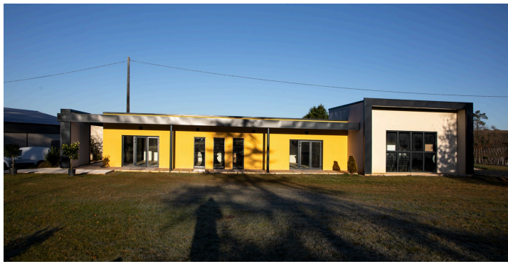
La même salle vue de l'extérieur