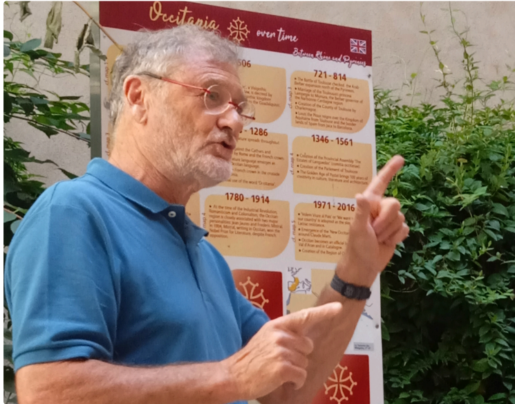
J'aurai tant aimé vivre ....( 2ème partie)