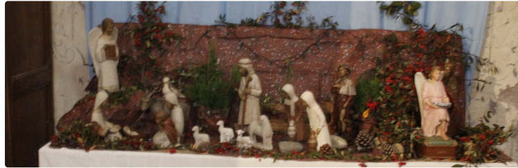
La ronde des crèches miélanaises

Il suffit de flâner dans les rues de Miélan, éventuellement muni d'un plan, pour découvrir la trentaine de crèches exposées à la vue de tous, dans une vitrine ou derrière la vitre d'un logement particulier.