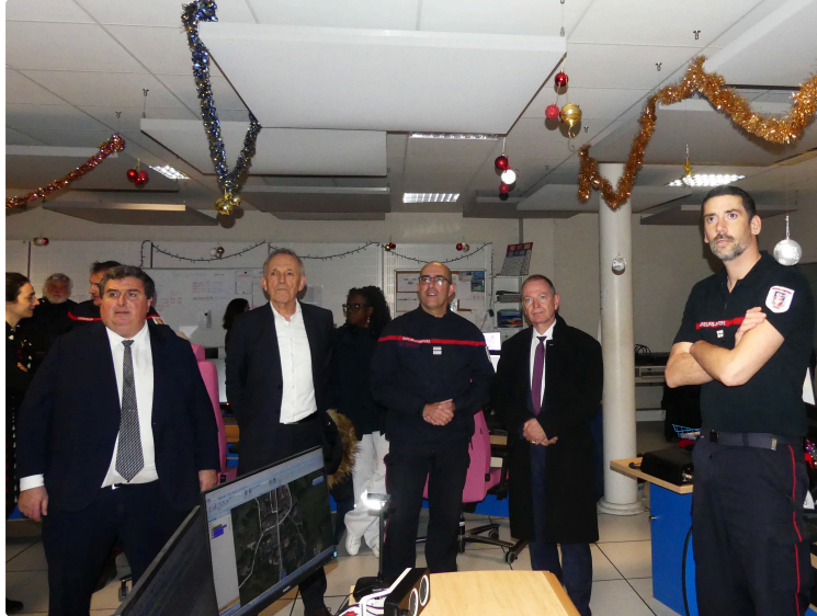
Le maître mot: on est prêt. Le préfet à rendu visite aux services de sécurité, secours et établissements de santé