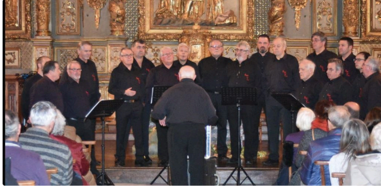
Vaya Con Dios en concert