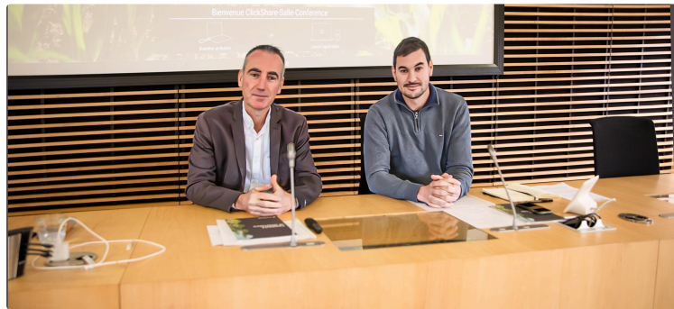
Riscle : Vivadour résilient malgré les aléas climatiques et géopolitiques