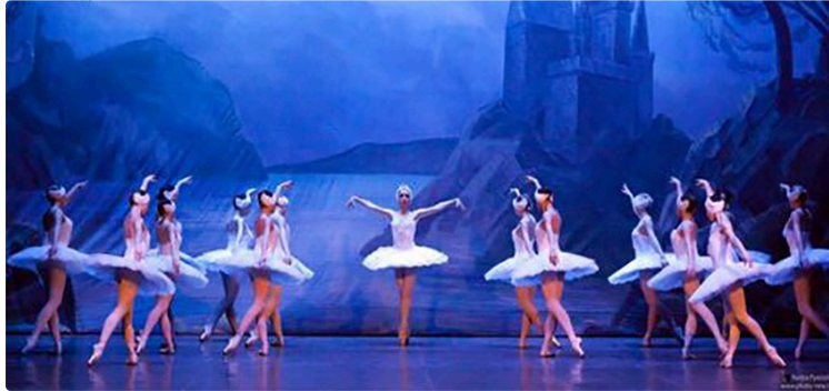
Le Lac des Cygnes : un évènement exceptionnel salle André Beaudran

les réservations ouvertes a compter du 5 décembre