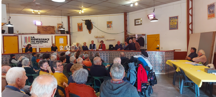
La Bienfaisance : une association historique toujours très active de 242 adhérents