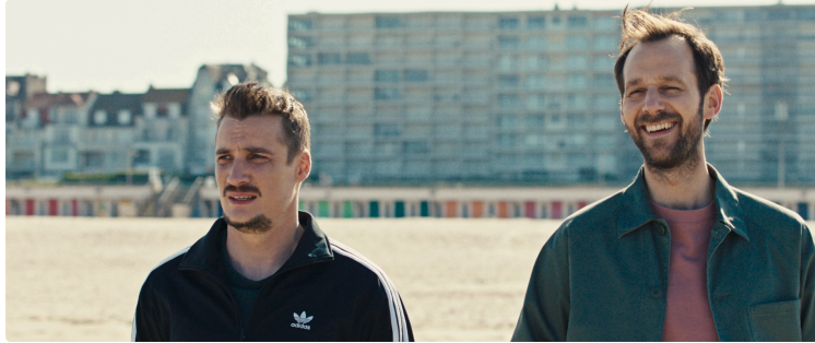
Cinequanon : au programme de votre cinéma cette semaine !