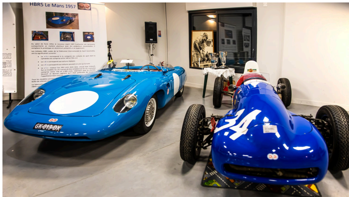
La DB (à g.) et la Monomill