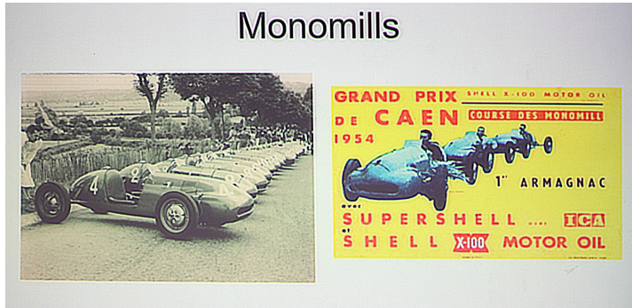
Victoire en Monomill