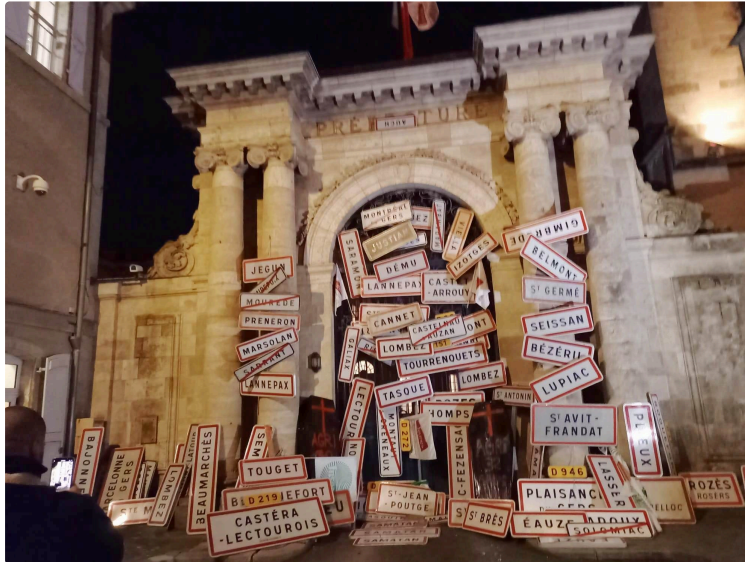
JA32 et FDSEA32, les feux de la colère

Les Jeunes agriculteurs du Gers et la FDSEA 32 se sont mobilisés ce lundi après-midi 18 novembre à Auch « pour faire entendre leur détresse, pour rétablir une agriculture plus juste et plus sereine pour la ferme Gers et s'ériger contre un possible accord entre UE/Mercosur ». C'est donc avec une cinquantaine de tracteurs qu'ils manifestèrent sur le rond-point des Justes, le rond point de Saint-Cricq, le rond point de Pavie, le rond point de la Patte-d'Oie avant de se retrouver place de la cathédrale à Auch et devant la préfecture.