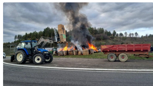
ROD POINT DE SAINT-CRICQ.jpg