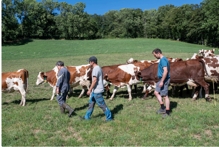
Une soirée au cinéma pour échanger sur la ruralité

Comme chaque année, Cineqanon propose une soirée pour échanger sur la ruralité aujourd'hui