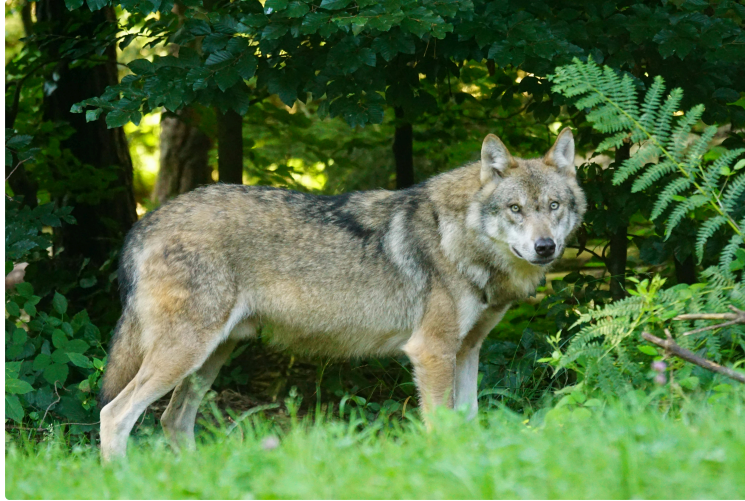
Loup y es-tu ? Un loup en Gironde !

« Oui, je suis bien là, on m'a même filmé et pris en photo pendant que je me promenais dans une réserve ornithologique ! »