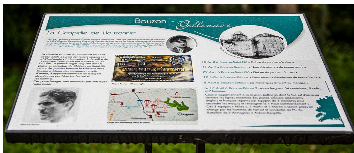
Le pupitre à côté de la chapelle de Bouzonnet