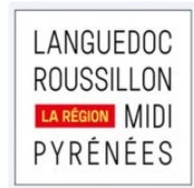
POLITIQUE La nouvelle région se met en place

Lundi mise en place officielle de la nouvelle région