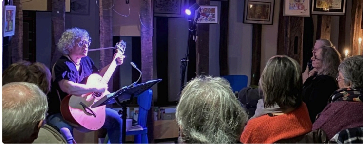
“ Soirée aux chants d'elle ” à la médiathèque.

Vendredi 15 novembre à 20h30 la médiathèque vous propose une rencontre musicale avec la chanteuse Philomène qui interprétera un répertoire de chansons françaises et sud-américaines, entre lesquelles elle glissera quelques unes de ses propres compositions extraites de son album " Juste Toi ". Une heure environ entre rire et émotion.