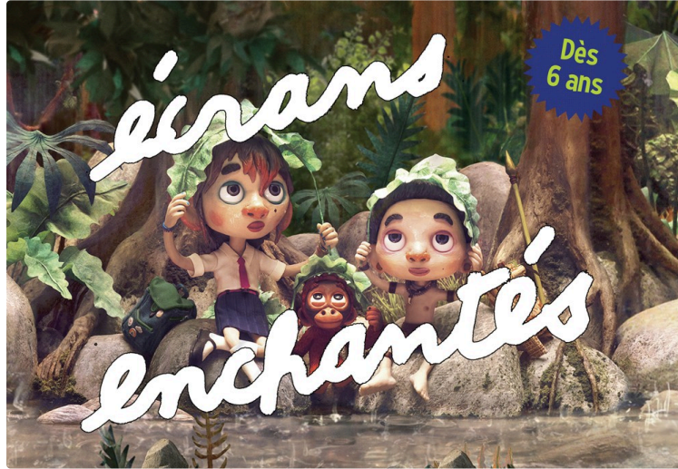
Demain à CINE 32

"Sauvages" + débat sur la forêt avec Arbres et Paysages en partenariat avec l'ASPAD à l'occasion de la Fête de l'Arbre