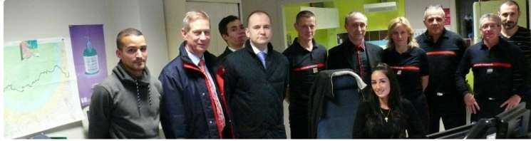
AUCH Les opérateurs de la plateforme du SDIS sereins pour leur soirée de la Saint-Sylvestre

Ils ne s'attendent pas à une soirée plus agitée que les autres