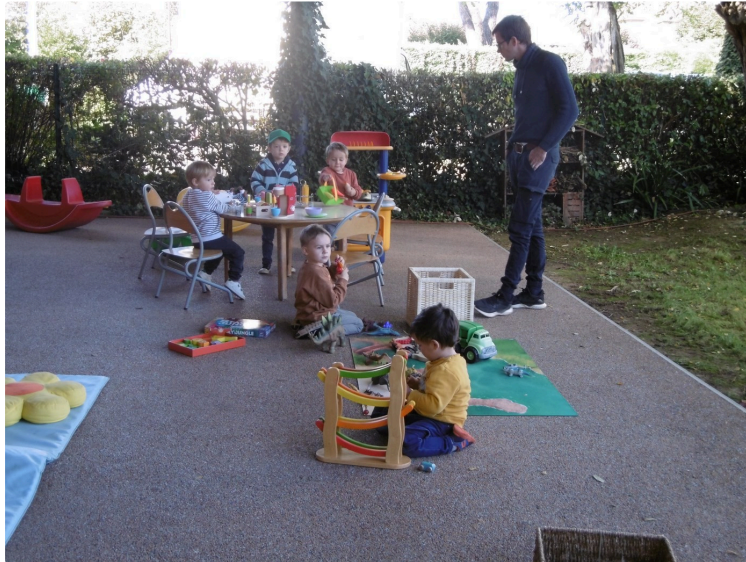
Belle journée enfants-parents à la Maison de l'Enfance Val de Gers

Avec un grand investissement des organisateurs et quelques associations