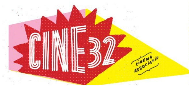
Les animations de l'après festival