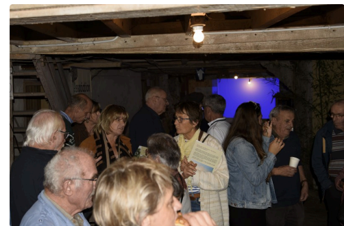
Soirée moulin 21092024 (5).jpg