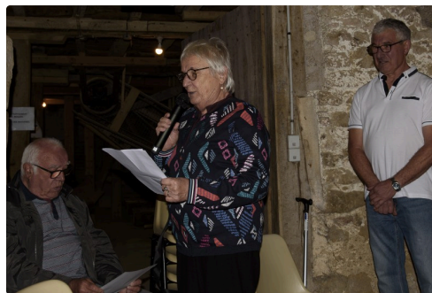
Soirée moulin 21092024 (2).jpg