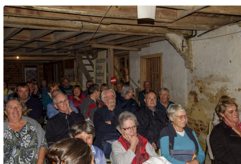
Soirée moulin 21092024 (4).jpg