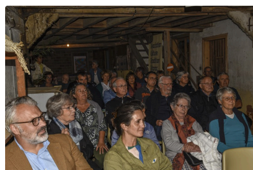
Soirée moulin 21092024 (3).jpg