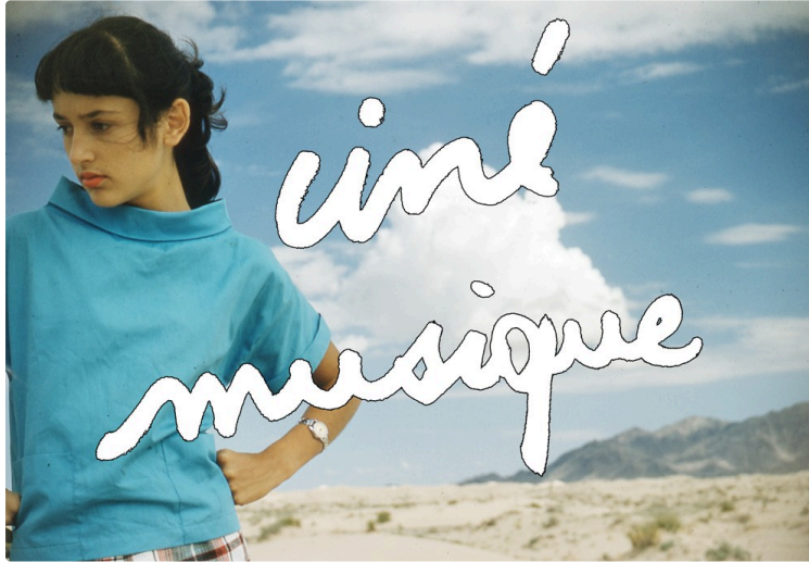
Les prochaines animations à CINE 32

A l'affiche deux événements : Unipop et Ciné musique