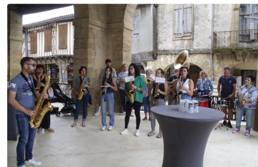
Miélan 15082024 (35).JPG