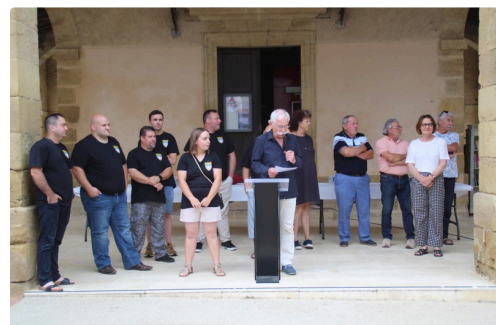
Miélan 15082024 (21).JPG

23H Bal disco avec le podium Adishatz, invité par le comité des fêtes.