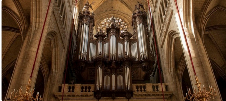
Claviers en Pays d'Auch l'été s'ouvre ce dimanche 14 juillet

La programmation d'été de Claviers en Pays d'Auch s'ouvre ce dimanche 14 Juillet à 18h00 en la cathédrale Sainte-Marie d'Auch.