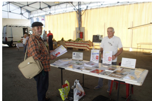
Recueil N°20 11072024 (6).JPG