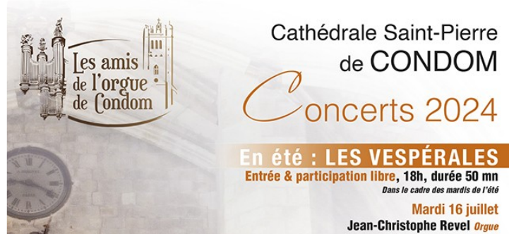
Les vespérales prochain concert