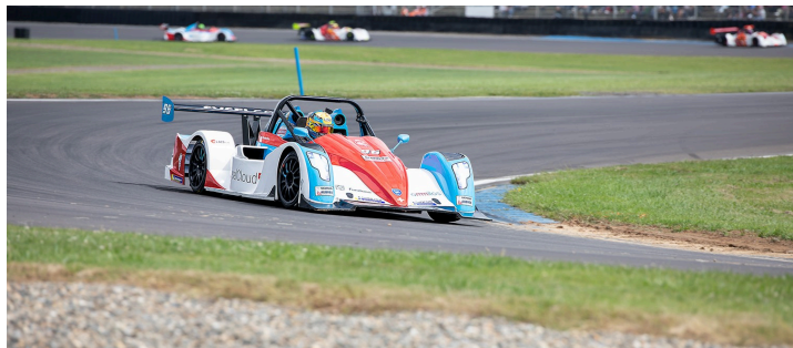
Funyo course 4 : gros plan sur Hugo Rouèche