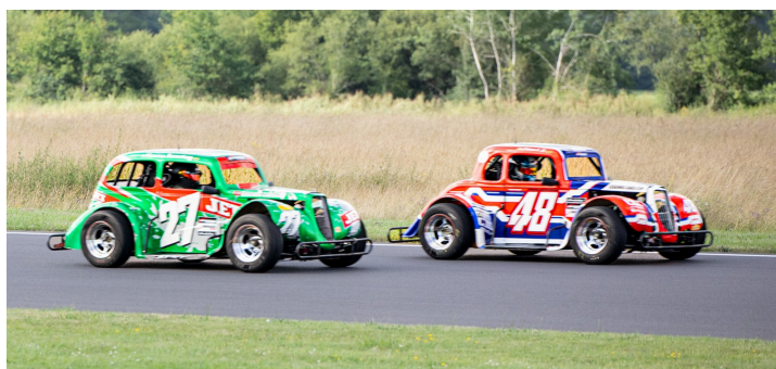
Legends Cars course longue : Thibaut Chiron devant Maxime Sonntag