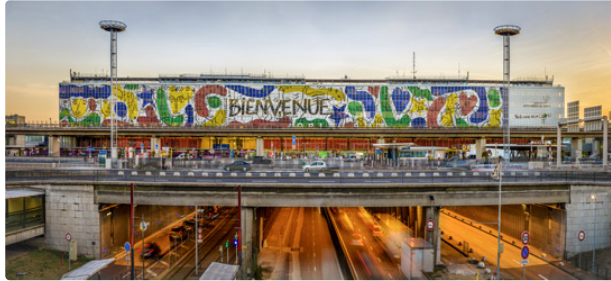
Jean-Charles de Castelbajac