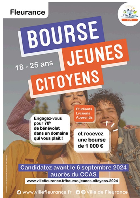
fleurance bourse jeune affiche .jpg

Pour candidater, adressez votre lettre de motivation au CCAS avant le 6 septembre en précisant vos motivations ainsi que les domaines dans lesquels vous souhaitez effectuer votre mission citoyenne (solidarité, enfance, senior, CCAS...) : ccas@villefleurance.fr