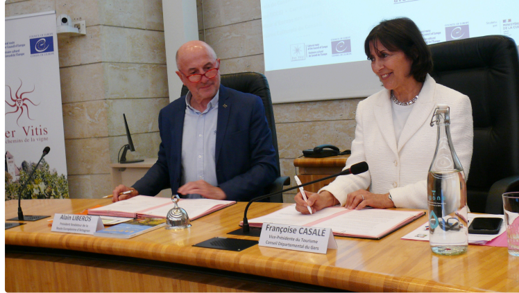
Le Département du Gers conforte ses liens touristiques et culturels autour de "La route européenne d'Artagnan"

Dans l'hémicycle du Conseil Départemental le 30 mai a été signée une convention de partenariat sur la mise en tourisme et la valorisation de la Route Européenne d'Artagnan dans le Gers. Cette convention a été paraphée par le Conseil Départemental, l'association européenne de la route d'Artagnan, AREA, et le Comité départemental du tourisme destination Gers. L'objet était de valider les modalités de partenariat entre les trois signataires pour contribuer au déploiement de AREA sur le territoire du Gers, sa mise en tourisme et sa valorisation culturelle en coopération étroite avec les collectivités infra-départementales (Communautés de communes, d'agglomération, Communes, les offices de tourisme) et les partenaires.