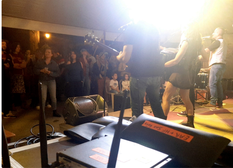
Soirée triomphale à Lasséran pour la deuxième année du café associatif !

Samedi 25 mai, le Café associatif de Lasséran , situé dans le paisible village de la Paix dans le Gers, a célébré son deuxième anniversaire avec une soirée mémorable qui a attiré de nombreux habitants et visiteurs de la région. Cet événement festif a bénéficié d'une météo clémente, contribuant à l'ambiance chaleureuse et conviviale qui caractérise ce lieu unique.