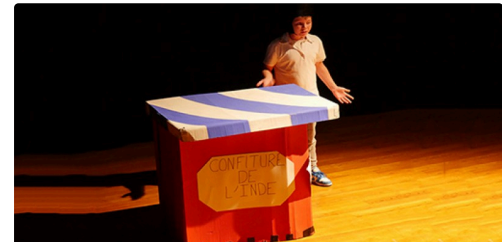
fleurance spectacle enfants jo (7).jpg