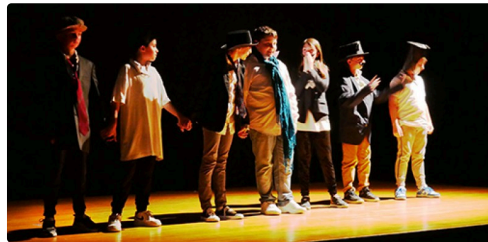
fleurance spectacle enfants jo (3).jpg