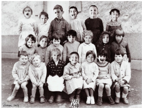
photo classe 2.jpg