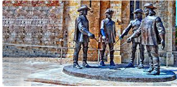
Restriction de circulation et de stationnement

Demain, samedi 18 mai 2024, la ville accueillera le relais de la flamme olympique.