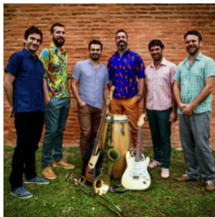
Le Tout Puissant Tropical Orchestra