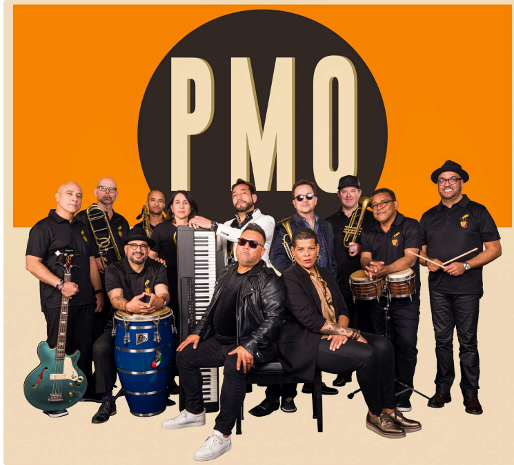
Tempo Latino 2024 : Total Mambo Tempo samedi 27 juillet !