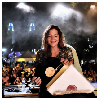
Dj Mambo Chick