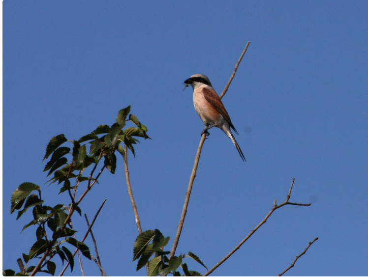
Pie-grièche : l'indice-qualité pour une biodiversité "made in Gers"

Pierre Forêt a délaissé les 2 CV et autres 4L pour revenir à ses premières amours, l'ornithologie !