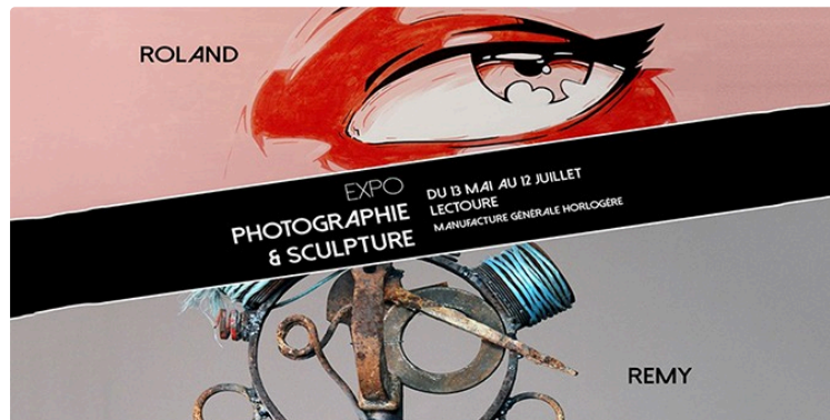
Nouvelle exposition à la Manufacture

La Manufacture présente une nouvelle exposition dans Le Couloir du Temps, l'artiste pop Roland qui propose un nouveau regard sur des stéréotypes bien ancrés dans la mémoire collective... et l'artiste plasticien pluridisciplinaire Remy qui, à travers des assemblages métalliques, nous partage sa vision du monde actuel !