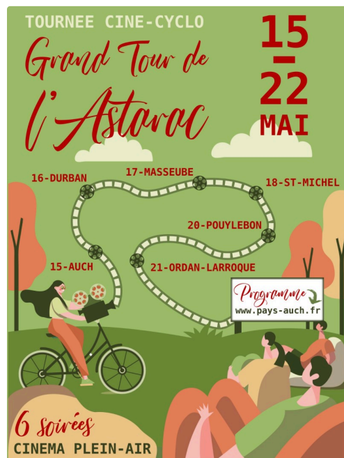
auch velo Tournee-Cine-Cyclo-2024.jpg

Pour fêter le lancement de ce premier circuit vélo en itinérance dans le Gers, le Pays d'Auch organise, du 15 au 21 mai, une tournée de 6 soirées en plein-air un peu particulières. Au programme, des documentaires, des témoignages et des rencontres pour apprendre et échanger sur les enjeux de la transition dans un cadre convivial.... le tout alimenté à la force des mollets. Chaque soirée sera organisée en partenariat avec une association locale en lien avec le thème du film projeté.