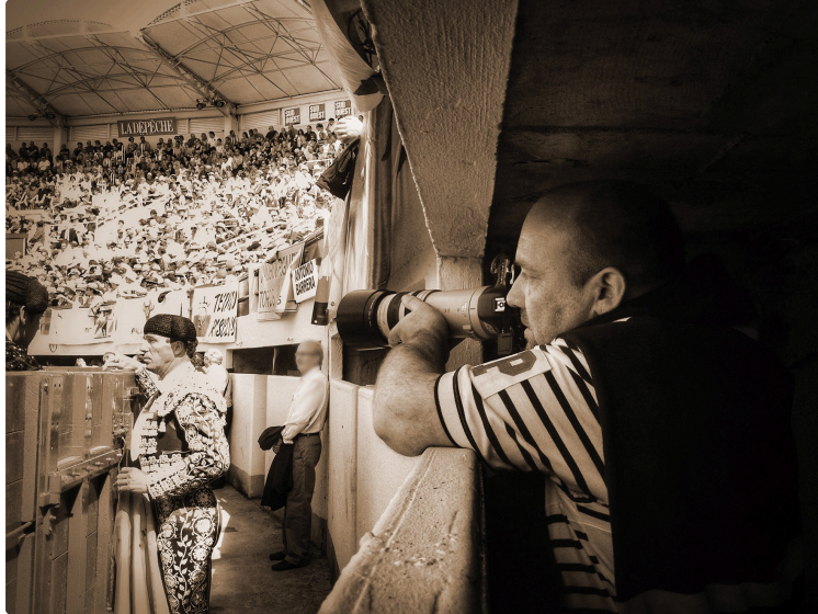
Circuit des arts Pentecôtavic 2024 : ELJO expose aux arènes « L'artauromachique »

Du 18 au 20 Mai 2024, Eljo vous dévoilera son exposition « L'artauromachique » d' une trentaine d'oeuvres , photographies et peintures dans la galerie des arènes de Joseph Fourniol à Vic-Fezensac durant tout le week-end de la fêria de Pentecôte.