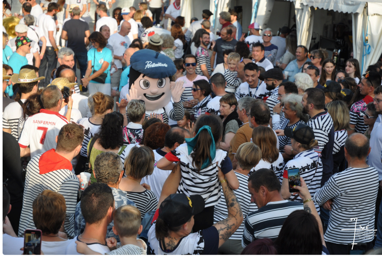
Pentecôtavic 2024 : distribution des bracelets gratuits et des laissez-passer pour les Vicois

Comme l'an passé, le périmètre de la fête sera fermé et payant pendant 3 jours.