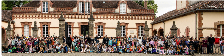
Perchède : Écofête junior au château de Pesquidoux

Thème : Transition écologique et alimentaire