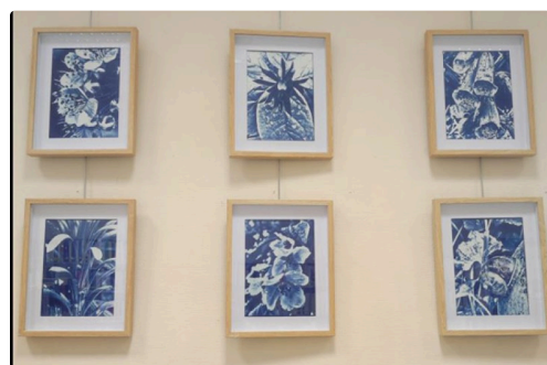
condom mediatheque bleu 1.JPG

A compter du 13 mai plongez dans le sport condomois de ces dernières décénies. Affiches et documents à l'appui découvrez deux siècles de sport dans la sous-préfecture.