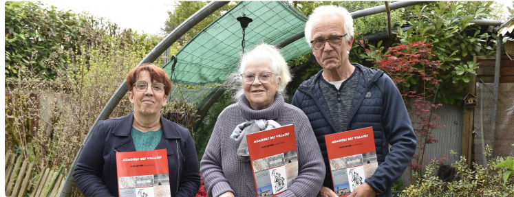
Mémoires des villages

L'ultime plaquette de Mémoires des villages sera disponible vendredi 19 avril à la médiathèque de Villecomtal sur Arros.